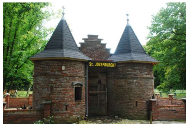
Na renovatie: St. Jozefburcht